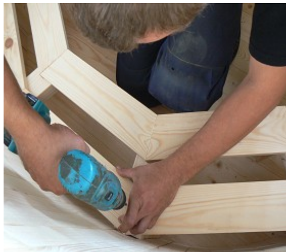
Foto 16. Istmelaudade kinnitamine

Kinnita laud kruvidega pingi jalgade külge nii, et istmelaua ots jääks toetuma pingi jala keskpunktile.