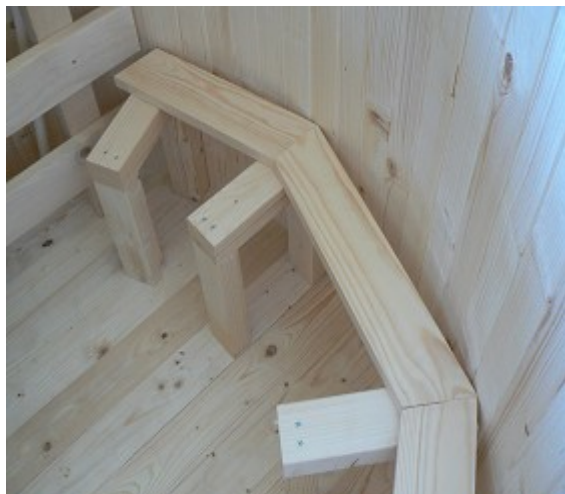
Foto 15. Istepinkide paigaldamine

Asetada pinkide jalad nii, et istmelaudade keskkohad asetseksid pinkide jalgade keskkohades (Foto 16). Kinnita pinkide jalad kruviga küljelippide külge. Alusta istmelaudade paigaldamist (Foto 17). Laudade pikematest külgedest moodustub pinkide välimine ring, lühematest külgedest sisemine ring.