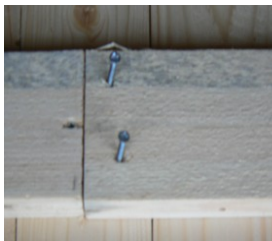
Foto 2. Kruvide keeramine põhjapõõnadesse

Tünn monteeri kokku põhi allpool. Aseta põhjaplaadid tasasele aluspinnale, põhjapõõnad ülespoole. Lükka põhjad soontesse üksteise sisse, et tekiks korrapärane ring. Keera kruvid (6 tk) põõnadesse. Seejärel keera põhi õigesse asendisse, põõnad allpool ja asetage tasasele alusele.