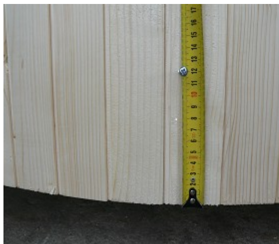
Foto 8. Alumise vitsa paigaldamine