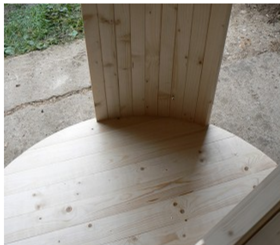
Foto 4. Paigalda lipid kellaosuti suunas