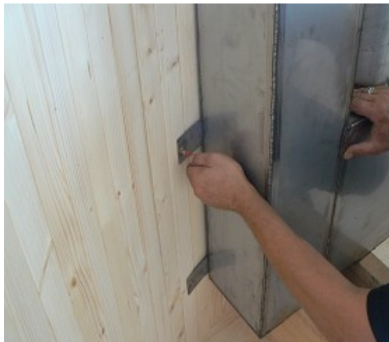
Foto 12. Puurimiskohtade märkimine