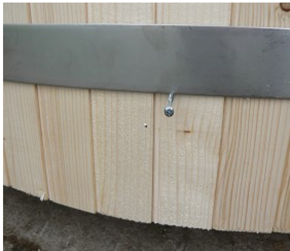
Foto 7. Vitsa paigaldamine

Kruvid (4tk), mille abil vitsad paigaldada, peaksid asetsema üksteisest umbes 90° nurga all. Alusta alumise vitsa paigaldamisest. Keera kruvid väheke küljelippide sisse ning aseta vits kruvidele toetuma (Foto 7). Kinnita vits alt äärest 12 cm ülespoole (Foto 8). Paigalda kinnituspoldid ja mutter (Foto 9). Vitsade kinnituspoldid peaksid jääma kohakuti ning veeäravoolu avast paremale.