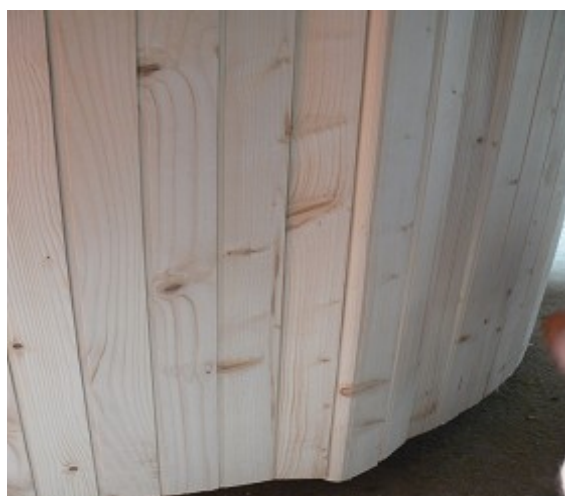
Foto 5. Viimase küljelipi paigaldamine