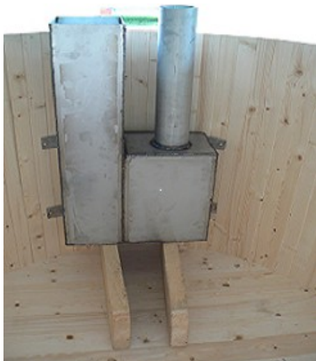
Foto 11. Ahju paigaldamine

Võta umbes 20 cm kõrgused klotsid. Aseta ahi nendele toetuma nii, et vee väljalaskeava jääks ahjust paremale (Foto 11). Ahju kinnituskohad seinal peaks jääma kohati tünni välisel küljel paiknevate vitsade kinnituspoltidega.