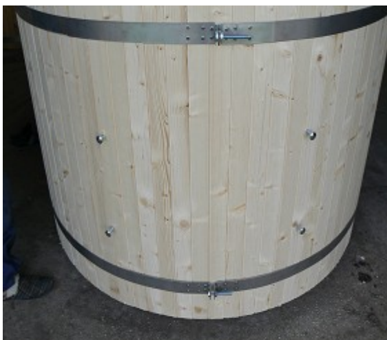
Foto 13. Ahju kinnituspoltide paigaldamine