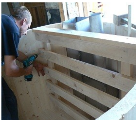
Foto 14. Vaheresti paigaldamine

Suru ahi vastu seina, märgi aukude keskkohd pliiatsiga (Foto 12). Eemalda ahi ära ning puuri augud eelnevalt märgitud kohtadele. Paigalda väljapoolt sissepoole poldid (Foto 13). Pane ahi tagasi nii, et kinnitusklambrid jääks kohakuti eelnevalt puuritud aukudega, seejärel kinnita ahi mutritega tünni seina külge.