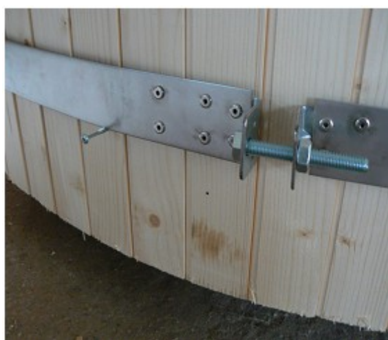
Foto 9. Pingutuspoldi kinnitamine