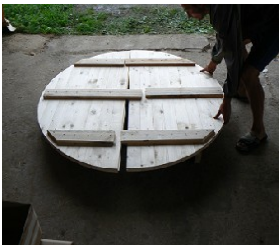
Foto 1. Põhjaplaadi kokkupanemine