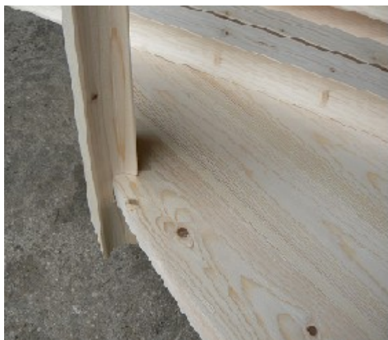
Foto 3. Küljelippide paigaldamine

Aseta esimene küljelipp soontpidi tünni põhjaplaadi külge (Foto 3). Liigu kellaosuti suunas. Aseta teine lipp esimese kõrvale nii, et lipi soonega külj lähedalt eelnevalt paigaldatud lipi külje sisse (Foto 4). Ära pane mingil juhul lippide vahele silikooni! Lippide õigesse asendisse saamiseks kasuta puidust või kummist haamrit.